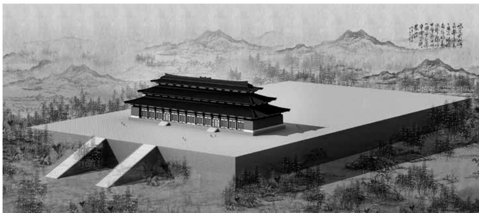
图 1-4 汉长安未央宫前殿推想图