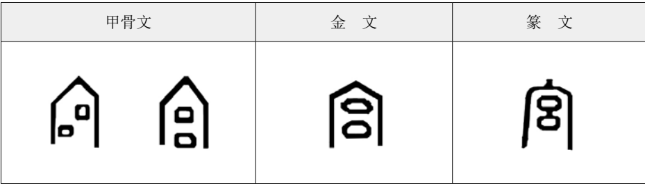
图 1-1 “宫”字的古代字形结构

宫，可能是汉字中最具形象感的一个字。与“室”字一样，“宫”字的宝盖头，象征了有屋顶的房屋，宝盖下面两个“口”字，恰像一个建筑群中，沿轴线布置的前后两座建筑，俨然是一个有屋顶矩形平面房屋组成的规制严整的建筑群。（图 1-1）这种建筑群，上古时期，称为“宫”。